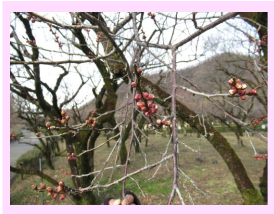
早咲鶯宿(はやざきおうしゆく)