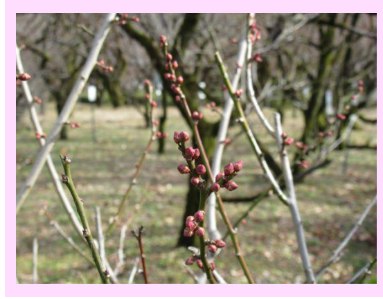
矮冬至(わいとうじ)