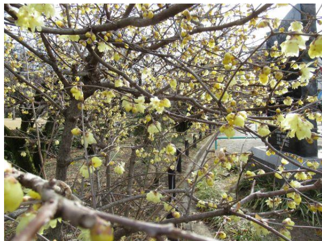
素心蠟梅（そしんろうばい）