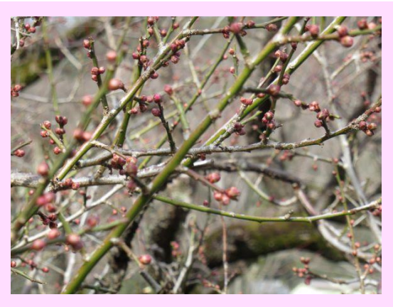
紅冬至(べにとうじ)