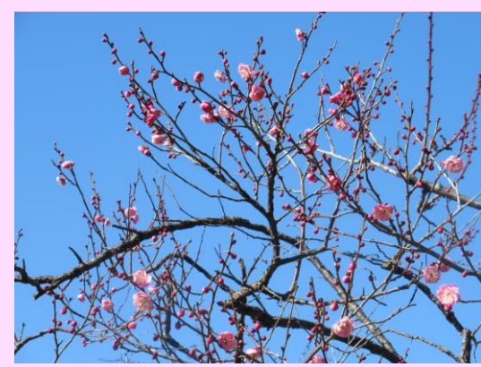
八重唐梅 (やえとうばい)