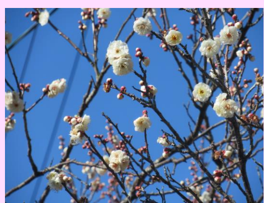
熊本早咲 (くまもとはやざき)