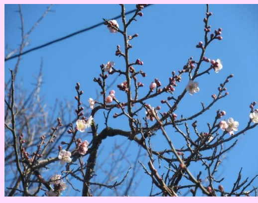
紅冬至 (こうとうじ)