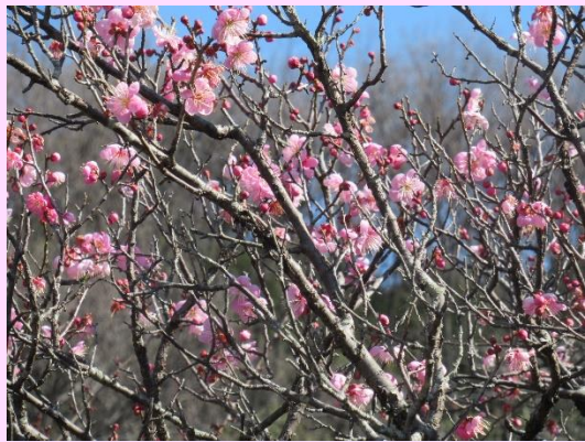
烈公梅 (れっこうばい)