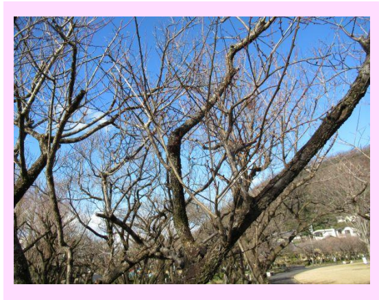
寒紅梅(かんこうばい)