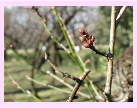
冬至梅(とうじばい)