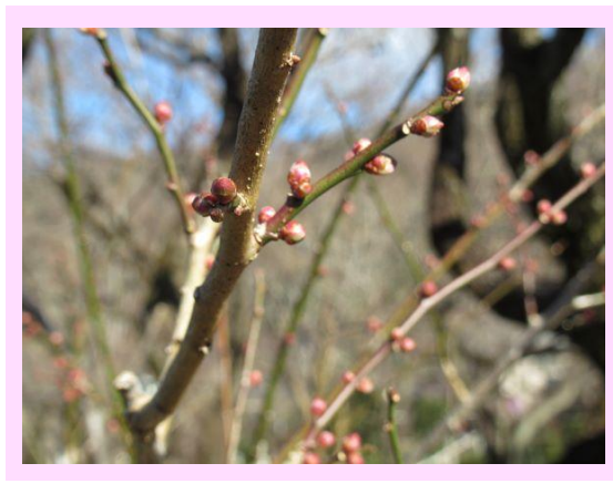
早咲鶯宿(はやざきおうしゆく)