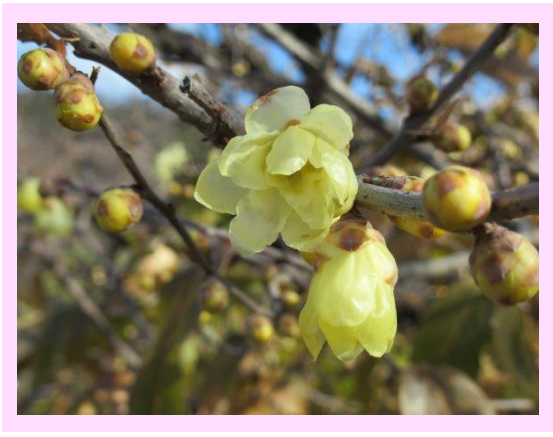
素心蟠梅(そしんろうばい)