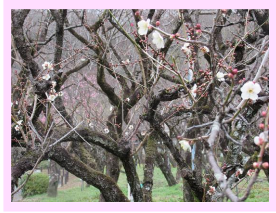
矮冬至(わいとうじ)