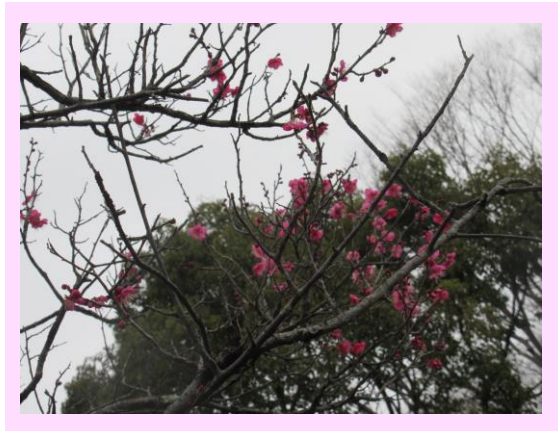
大盃(おおさかずき)