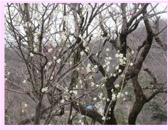
一重緑萼(ひとえりよくがく)