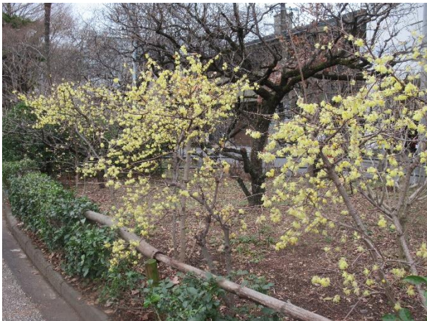
素心蠟梅 (そしんろうばい)