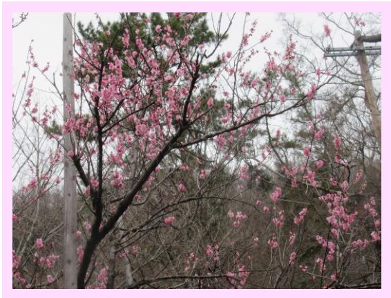
一重寒紅(ひとえかんこう)