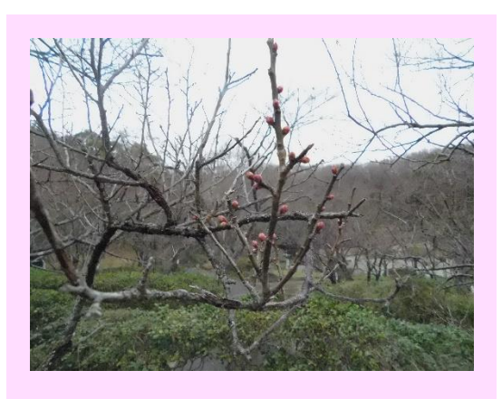
植物季節観測用標本