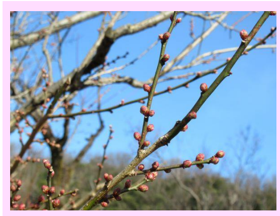
早咲鶯宿 (はやざきおうしゆく)