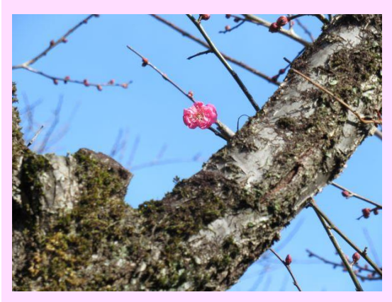
寒紅梅 (かんこうばい)