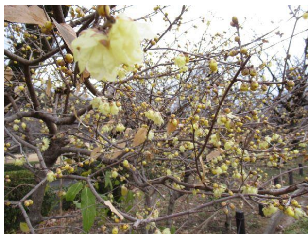
素心蠟梅(そしんろうばい)