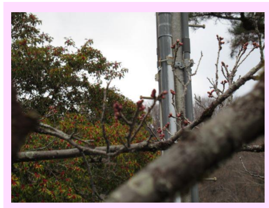
熊本早咲 (くまもとはやざき)