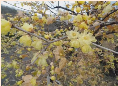
ソシンロウバイ 平成31年1月17日撮影