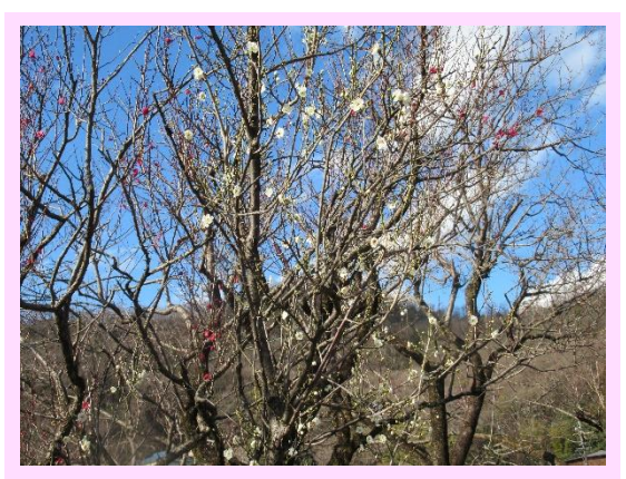
一重緑萼(ひとえりよくがく)