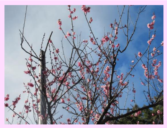
一重寒紅(ひとえかんこう)