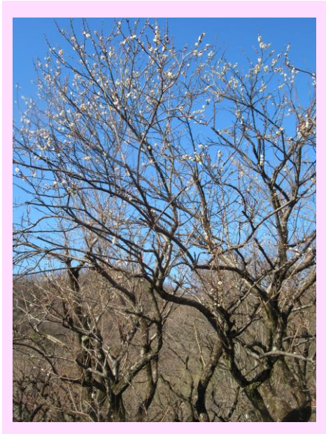
早咲鶯宿(はやざきおうしゆく)