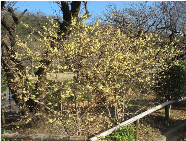
素心蠟梅 (そしんろうばい)